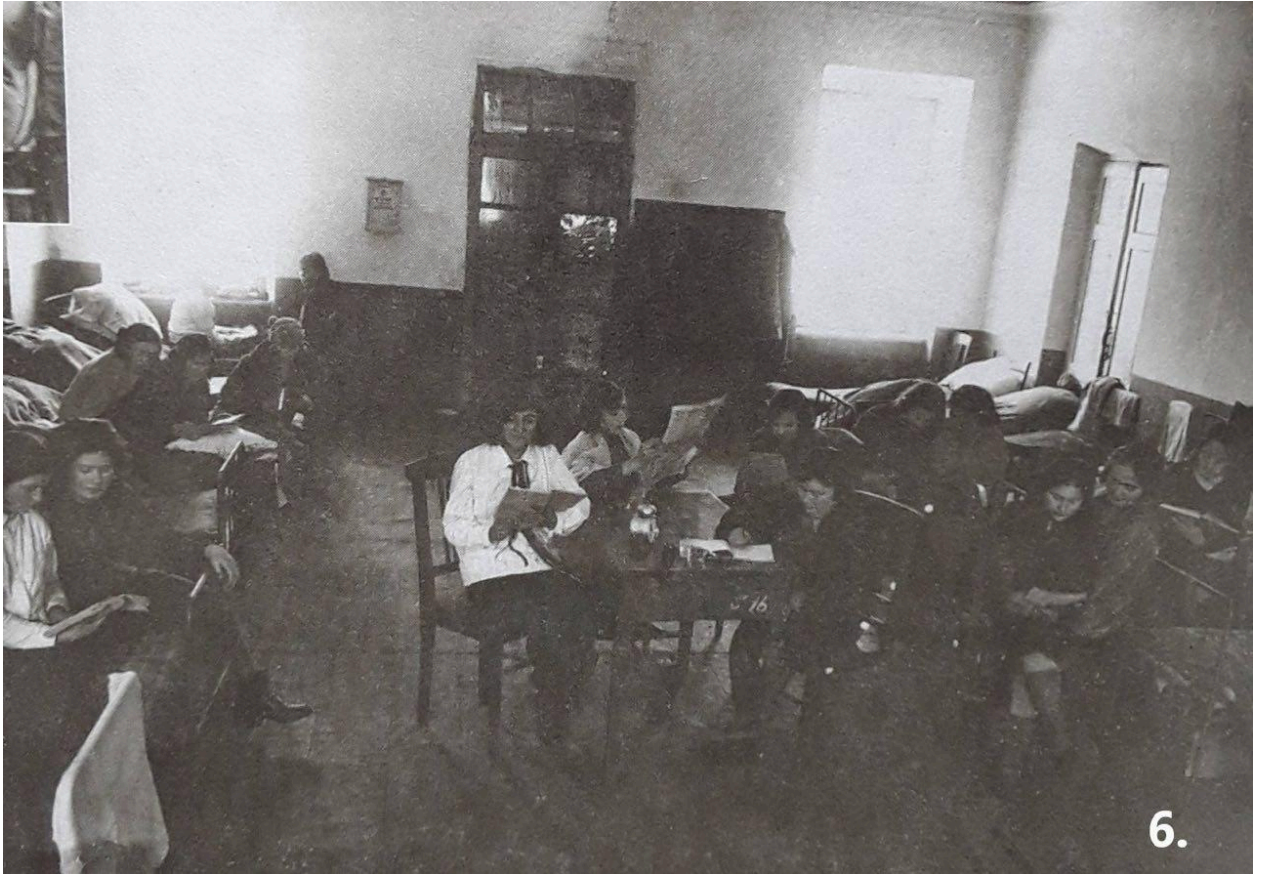
В гуртожитку фармінституту. 1931 рік

Сучасній людині, мабуть, важко уявити, як встигали тодішні студенти освоювати премудрості медицини в обстановці необхідності зубрити талмуди «марксистсько-ленінської філософії, діалектичного матеріалізму» тощо, а ще щодня, щогодинно брати участь у всьому виду формальних витребеньках «соціалістичного змагання» в освітньому процесі, безконечних комсомольських зборах і розборках в комітетах і т.д. Заирнути за завісу минулого можемо з допомогою тодішньої преси: