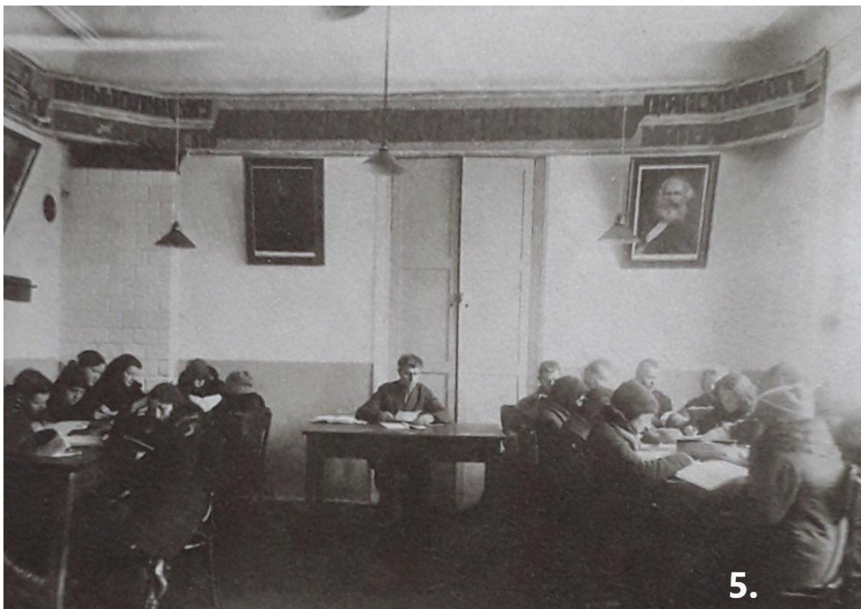
В бібліотеці фармінституту. 1931 рік

Велику увагу приділяє інститут громадській роботі. Поліпшення громадського харчування, зміцнення обороноспроможности країни знаходять свій відбиток в організації спеціальних лабораторій при інституті, в навчанні студентства прикладати свої знання на фронті реконструкції побуту трудящих. Ліквідація неписьменности, культ-шефство над колгоспами, боротьба з релігійними забобонами тощо посідають значне місце в роботі інституту.