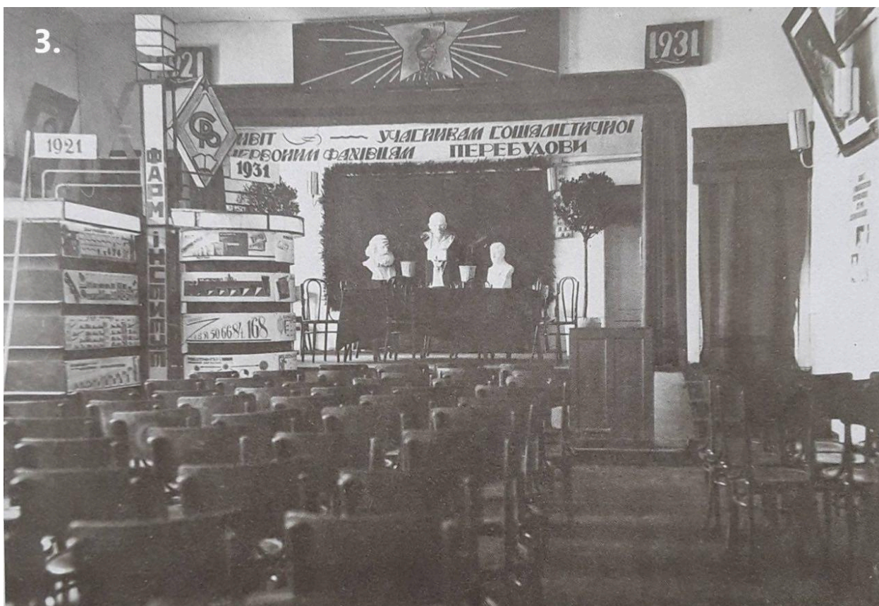
Актова зала фармацевтичного інституту. 1931 рік