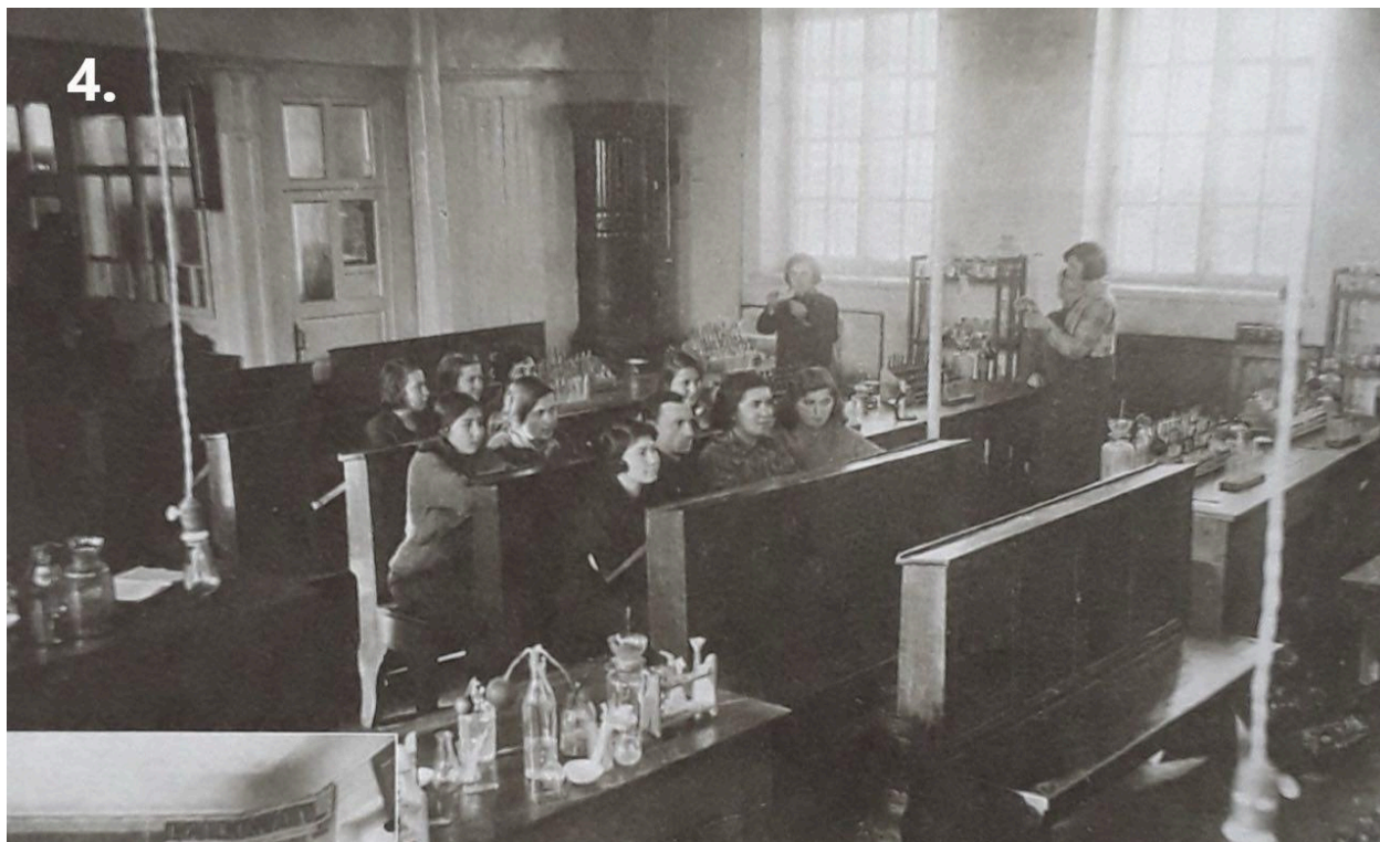
Лабораторне заняття в фармінституті. 1931 рік

Цього, безперечно, замало. Для теперішніх умов такі темпи в роботі інституту ще незадовільні. Розвиток нашого господарства вимагає значно більшої кількості фахівців. Отже, фармінститут повинен збільшити, найближчим часом кадри студентства.