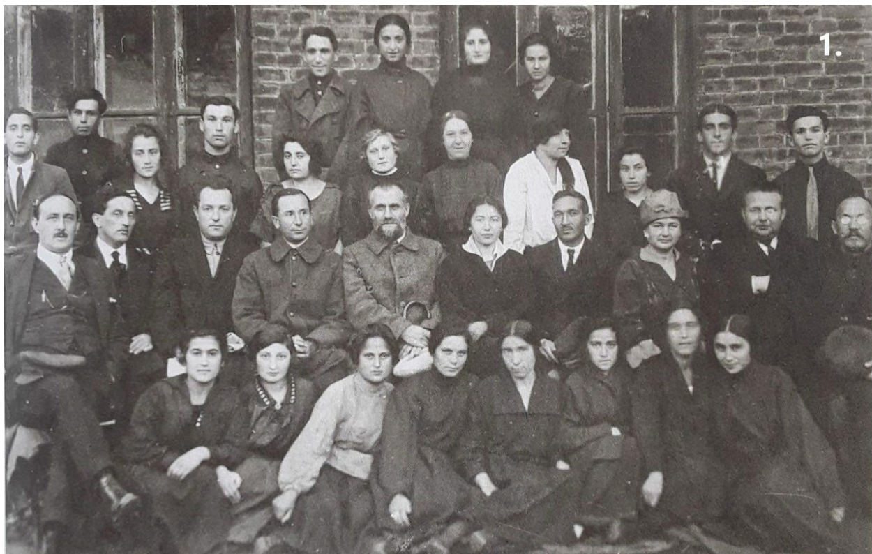
Перший випуск Вінницької медиколи. 1923 рік

У вересні 1921 року у Вінниці почалися заняття в акушерській школі та фармацевтичному технікумі. Заняття проходили у важких умовах: в класах не було електричного освітлення, не вистачало підручників, наочного приладдя. Та, незважаючи на це, влітку 1923 року відбувся перший випуск. 50 молодих спеціалістів поїхали на роботу, де найбільше відчувалася нестача медичних працівників.