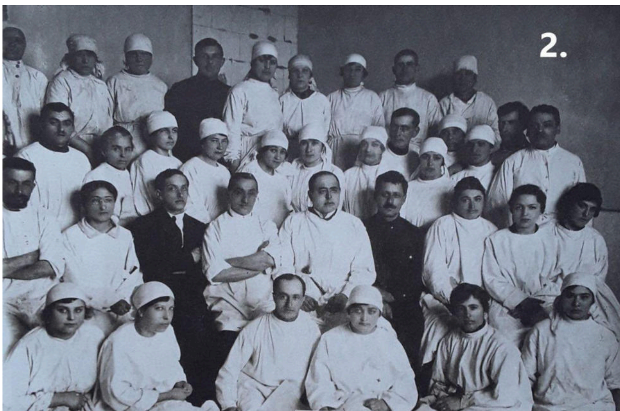
2. Вінницька робітничка лікарня, 1 квітня 1923 року