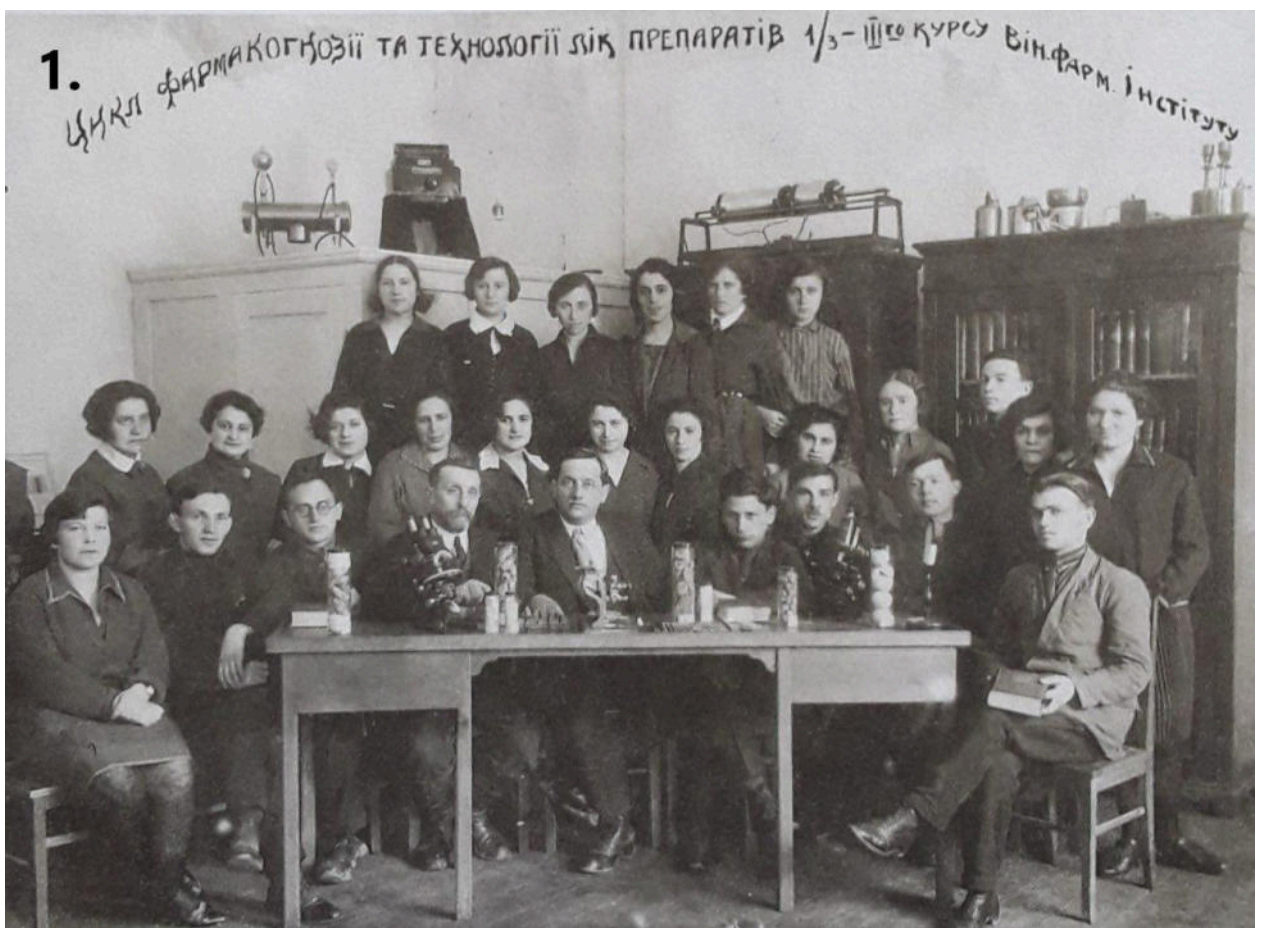
1. 3-й курс Вінницького фармінституту