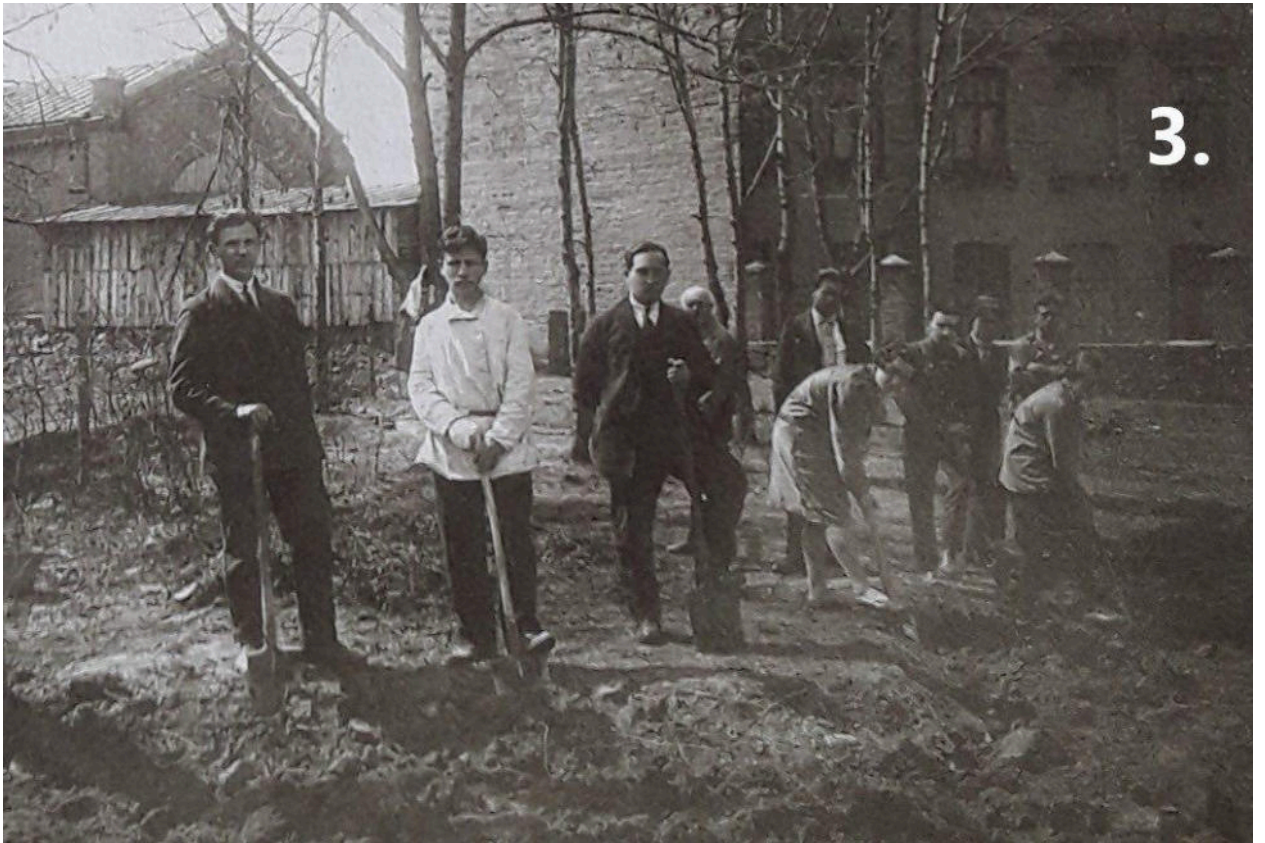
3. Садок лікарських рослин Вінницького хіміко-фармацевтичного технікуму

Джерела: Газета «Вісти-Известия» (1921); Вінниця у спогадах у III томах (т.3) (Вінниця, ПРТА «Віноблдрукарня»)