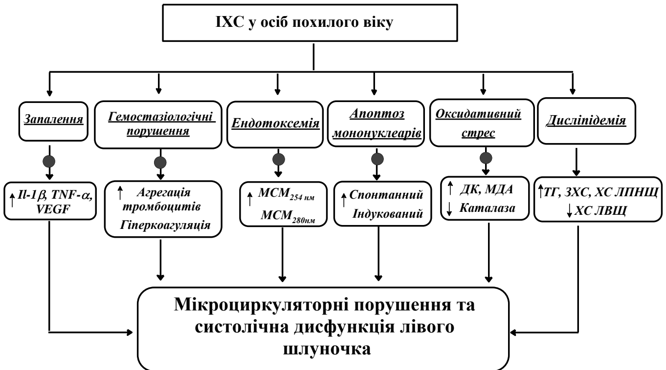
Рис. 2. Біохімічні механізми розвитку мікроциркуляторних порушень у осіб похилого віку з ІХС та шляхи реалізації ендотеліотропної та кардіопротективної дії пентоксифіліну (●).

За результатами власних досліджень та даних літератури було складено схему можливих біохімічних механізмів, які інтегровані у розвиток мікроциркуляторних порушень у хворих на ІХС (рис. 2).